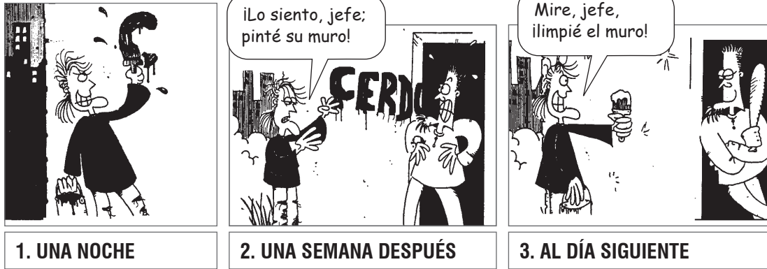
1. UNA NOCHE